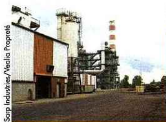
Sarp Industries/Veolia Propreté